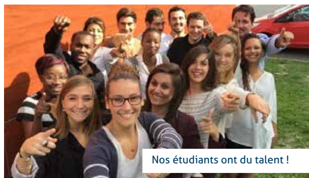
Nos étudiants ont du talent !