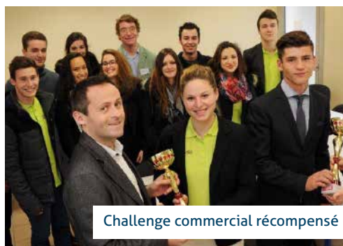
Challenge commercial récompensé